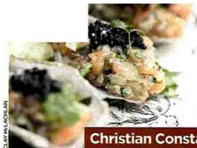
CLAY MAC LACHLAN