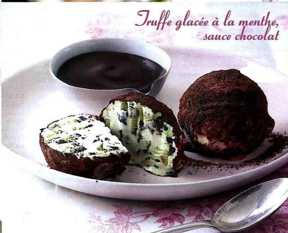
Truffe glacée à la menthe, sauce chocolat