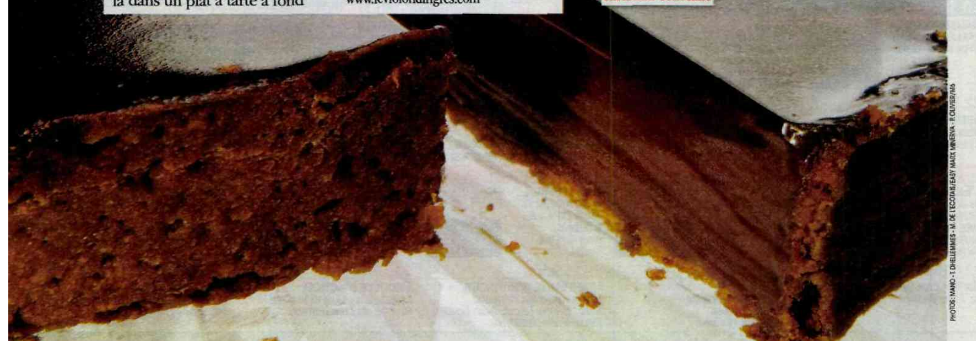
PHOTOS: MANDI - DRELLIEMES - M. DE ESCOFFIER/BEAUVAULT, MARRASIN - FLOUVERIAS